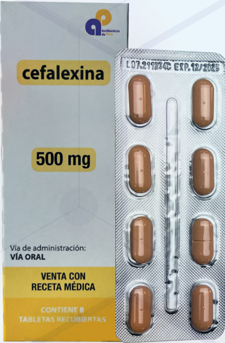
CEFALEXINA 500MG TABLETA RECUBIERTA

ANTIBIOTICOS DE PERÚ S.A.C. actualmente tiene a la empresa PRODIS S.A.C. como Operador Logístico Tercerizado. Contamos con certificación en Buenas Prácticas de Almacenamiento y Buenas Prácticas de Distribución y Transportes , emitidas por la Autoridad de Salud, de esta manera aseguramos la conservación de la calidad de nuestros Productos.