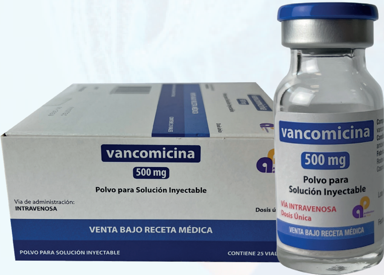
VANCOMICINA 500MG POLVO PARA SOLUCIÓN INYECTABLE