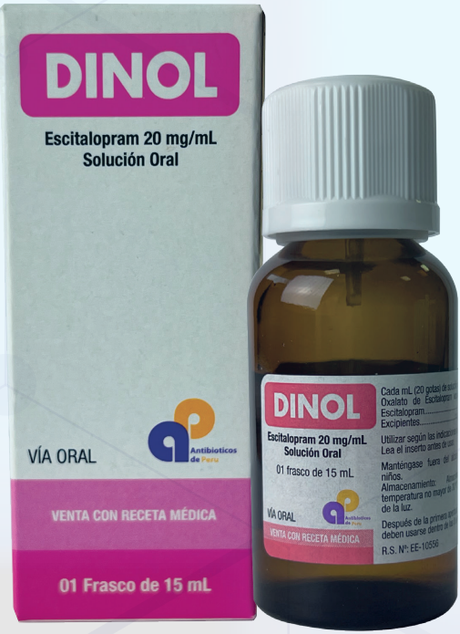
DINOL 20mg/mL SOLUCIÓN ORAL